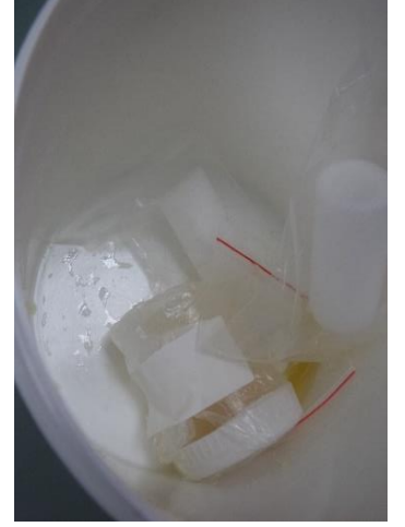
Kurumumuza gönderilen uygun olmayan numuneler

5-) İstenilen tetkike ait numuneler mutlaka Numune Alma El Kitabına uygun olarak alındıktan sonra nakile uygun numune kabı (tüp, besi yeri, steril idrar kabı v.s.) ile birimimize gönderilecektir. (Şayet gönderilmeyip bekletilecek ise mutlaka soğuk zincir kurallarına uygun olarak buzdolabında saklanarak bekletilmesi gerekmektedir.)